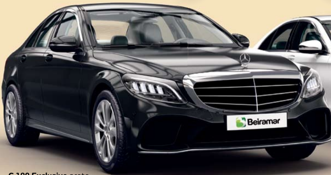
C 180 Exclusive preto Sorteio: 20/12/2019