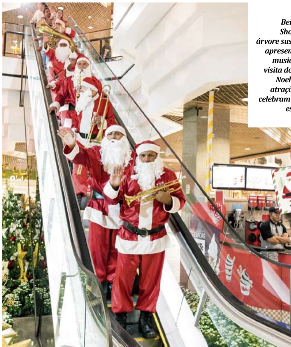
Beiramar Shopping: árvore suspensa, apresentações musicais e a visita do Papai Noel são as atrações que celebram a data este ano