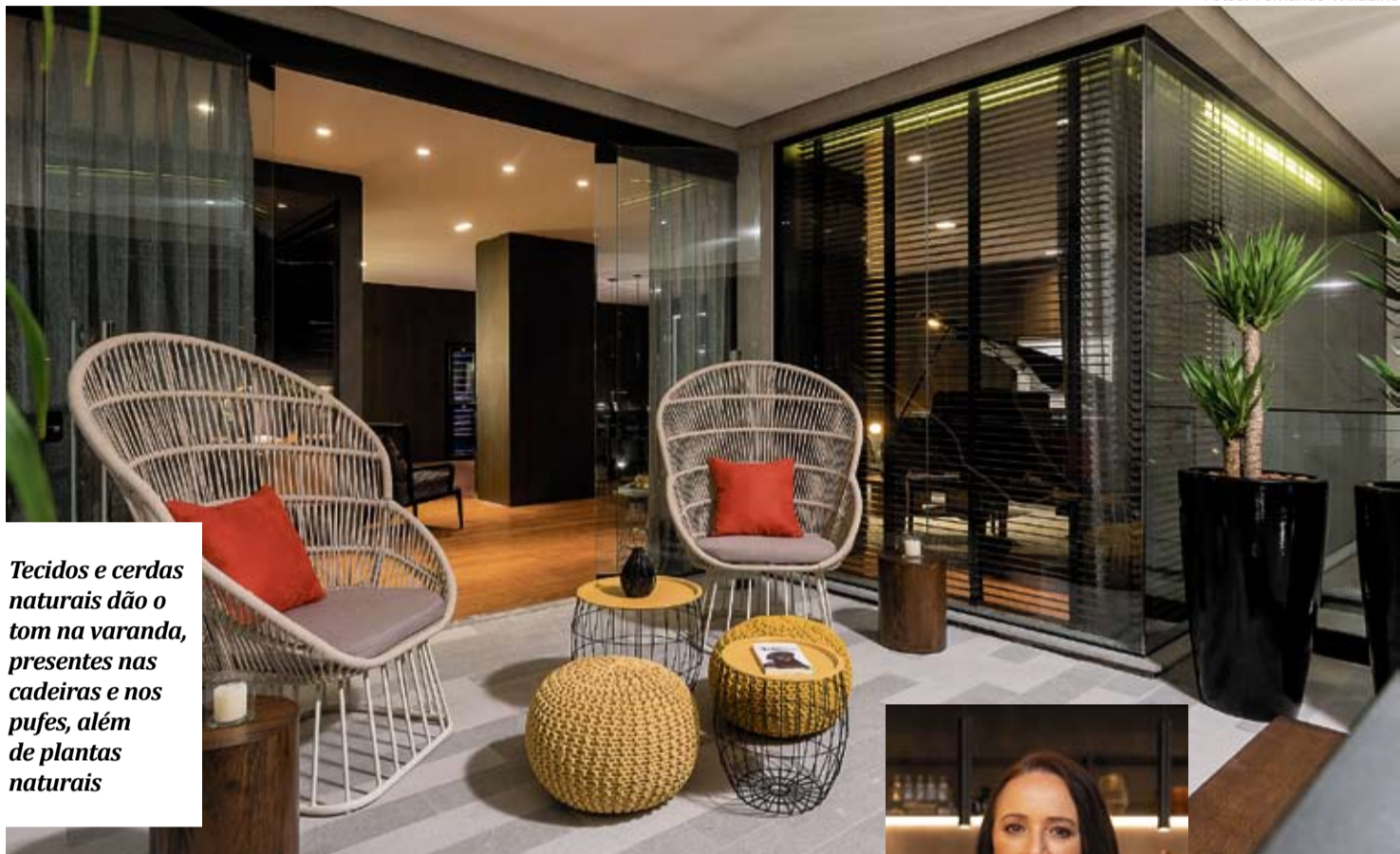
Tecidos e cerdas naturais dão o tom na varanda, presentes nas cadeiras e nos pufes, além de plantas naturais

Granito: muito utilizada como substituto do mármore, esta pedra também oferece alta durabilidade e pode ser usada em áreas internas e externas.