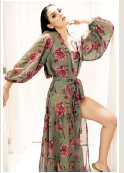
Elegância e versatilidade na beachwear