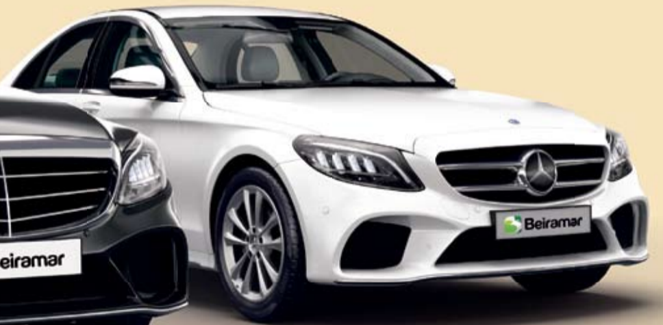
C 180 Avantgarde branco Sorteio: 06/01/2020

— Compre no Beiramar e concorra a: — 2 MERCEDES