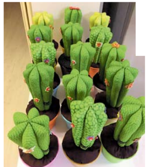
Os artigos estão à venda nas lojas da rede Guacamole