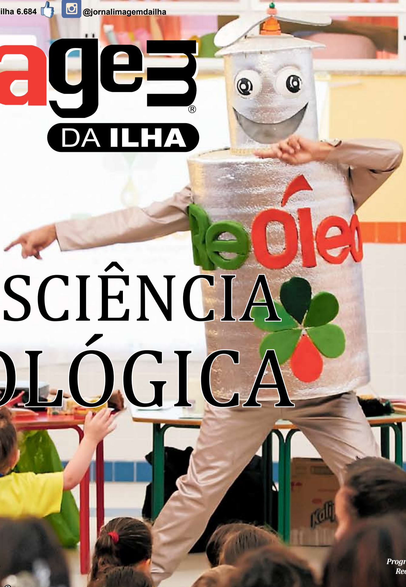
image3 DA ILHA