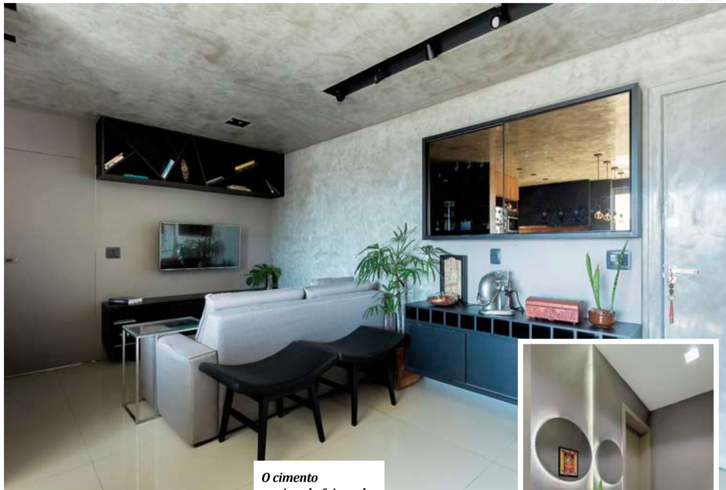
O cimento queimado foi usado no teto e na parede e dá um ar cool a composição

Para minimizar o aparecimento de fissuras no piso, o recurso principal é a aplicação de juntas de dilatação, formando panos