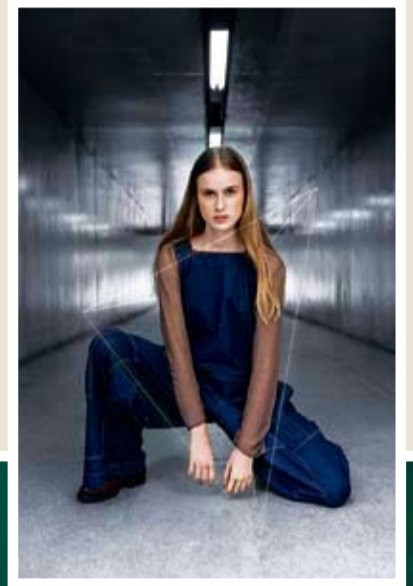
Aposta é em peças amplas, funcionais e em tons terrosos