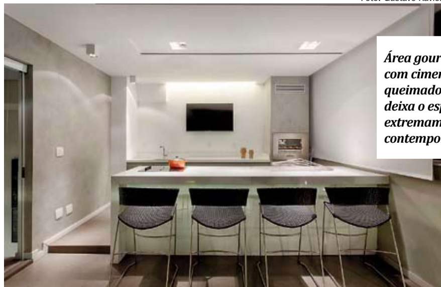
Área gourmet com cimento queimado deixa o espaço extremamente contemporâneo