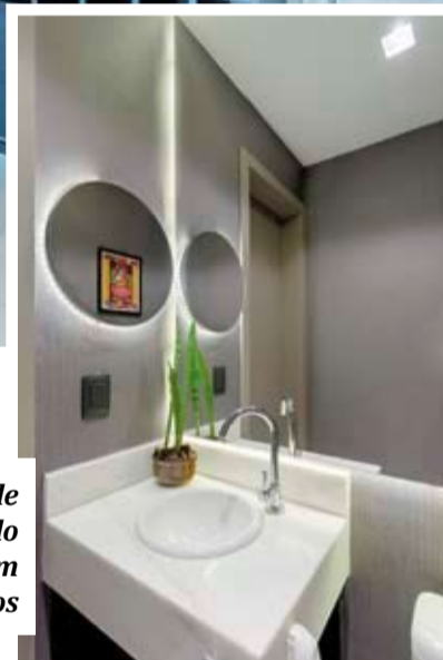
O recurso pode ser usado também em lavabos

de seção quadrada. Além disso, também deve ser dada atenção às condições climáticas no dia da execução do acabamento: umidade baixa e temperatura acima de 25°C aumentam a probabilidade de aparecimento de trincas superficiais.