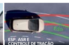
ESP, ASR E CONTROLE DE TRAÇÃO