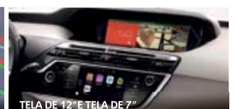
TELA DE 12" E TELA DE 7"

E MAIS: • 6 AIRBAGS EXCLUSIVOS (FRONTAL, PASSAGEIRO, LATERAL DE CORTINA) • BANCOS DIANTEIROS COM MASSAGEADOR • PORTA-MALAS DE ATÉ 630L • PACK CRIANÇA (CORTINAS, BANCOS DESLIZANTES NA 2ª FILEIRA, ESPELHO CONVEXO E MESINHA DE AVIÃO) • PARK ASSIST • HILL ASSIST • SENSORES DE LUMINOSIDADE, CHUVA E ESTACIONAMENTO • MOTOR TURBO THP 165CV COM CÂMBIO AUTOMÁTICO DE 6 MARCHAS E MUITO MAIS!