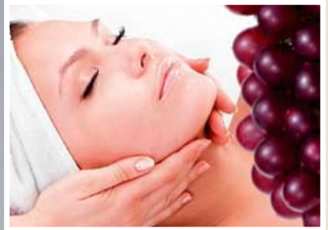
Benefícios para corpo e mente