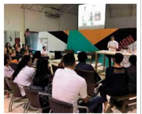
Design Business Fair