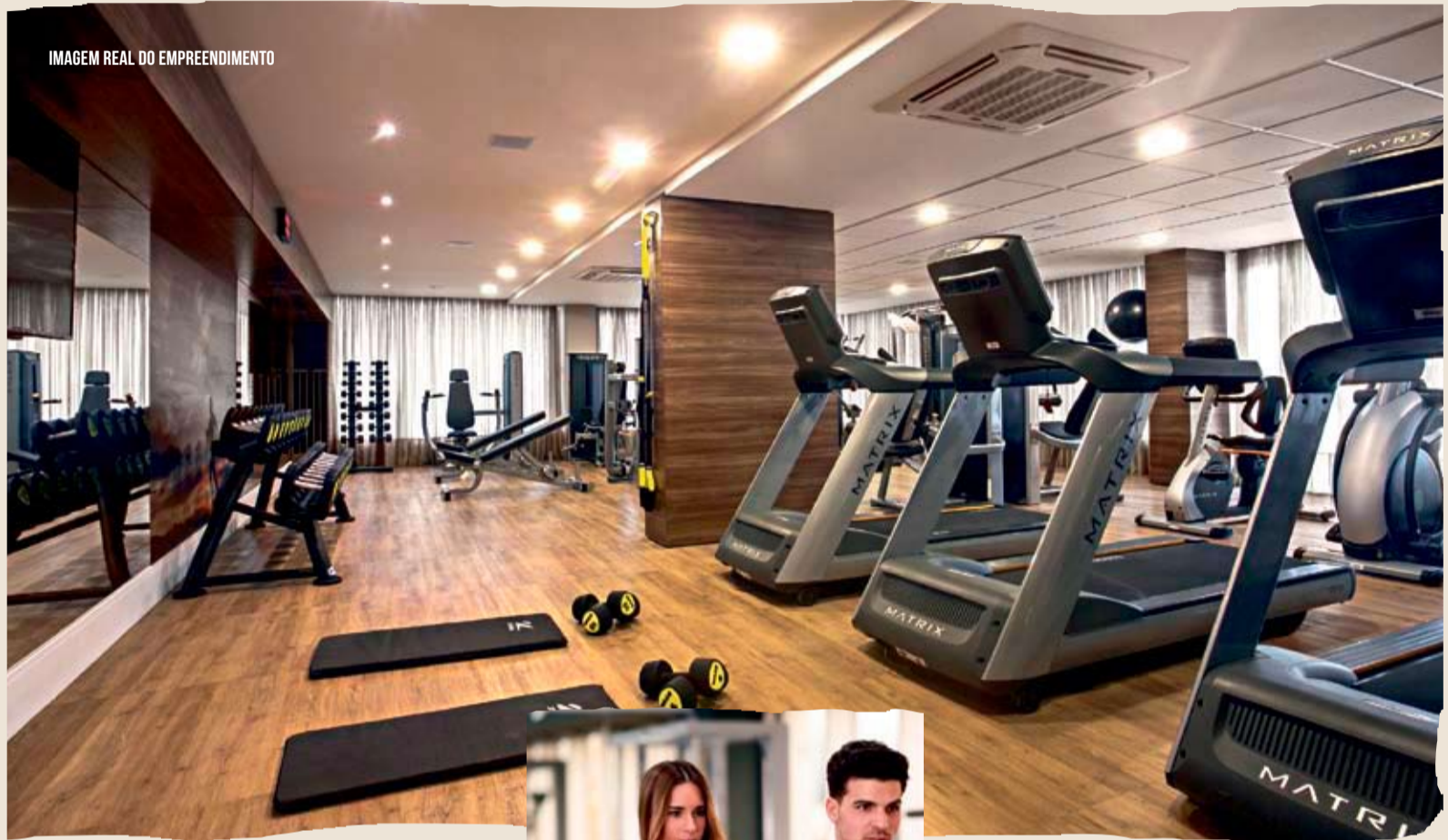
IMAGEM REAL DO EMPREENDIMENTO